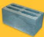
КАМЕНЬ СТЕНОВОЙ ПУСТОТЕЛЫЙ (390*190*188)

Кол-во в поддоне - 72 шт Масса 1 шт - 22 кг 1 м2 - 12,5 шт Масса 1 поддона - 1 615 кг