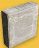
ТРОТУАРНАЯ ПЛИТКА “КВАДРАТ” (500X500X80)

без красит. – 945 руб/м 2 с красит. – 1 000 руб/м 2