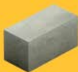
КАМЕНЬ СТЕНОВОЙ ПОЛНОТЕЛЫЙ (390*190*188)

Кол-во в поддоне - __ шт Масса 1 шт - __ кг 1 м2 - 12,5 шт Масса 1 поддона - __ кг