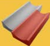
ЛОТОК МАЛЫЙ (500*200*70) ГЛУБИНА - 20

Кол-во в поддоне - 46 шт Масса 1 шт – 12,4 кг Масса 1 поддона - 600 кг