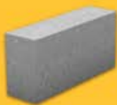
КАМЕНЬ ПЕРЕГОРОДОЧНЫЙ ПОЛНОТЕЛЫЙ (390*90*188)

Кол-во в поддоне - 120 шт Масса 1 шт - 13,35 кг 1 м2 - 12,5 шт Масса 1 поддона - 1 630 кг