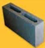
КАМЕНЬ ПЕРЕГОРОДОЧНЫЙ ПУСТОТЕЛЫЙ (390*90*188)

Кол-во в поддоне - 144 шт Масса 1 шт - 10,5 кг 1 м2 - 12,5 шт Масса 1 поддона - 1 545 кг