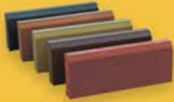
БОРДЮР ТРОТУАРНЫЙ БР 100.20.8

Кол-во в поддоне – 30 шт Масса 1 шт - 40 кг Масса 1 поддона - 1 200 кг