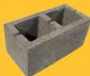
КАМЕНЬ СТЕНОВОЙ К/Б 2-Х ПУСТОТНЫЙ (390*190*188)

Кол-во в поддоне - __ шт Масса 1 шт - __ кг 1 м2 - 12,5 шт Масса 1 поддона - __ кг