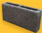
КАМЕНЬ ПЕРЕГОРОДОЧНЫЙ К/Б ПУСТОТЕЛЫЙ (390*90*188)

Кол-во в поддоне - 144 шт Масса 1 шт - 8,5 кг 1 м2 - 12,5 шт Масса 1 поддона - 1 255 кг